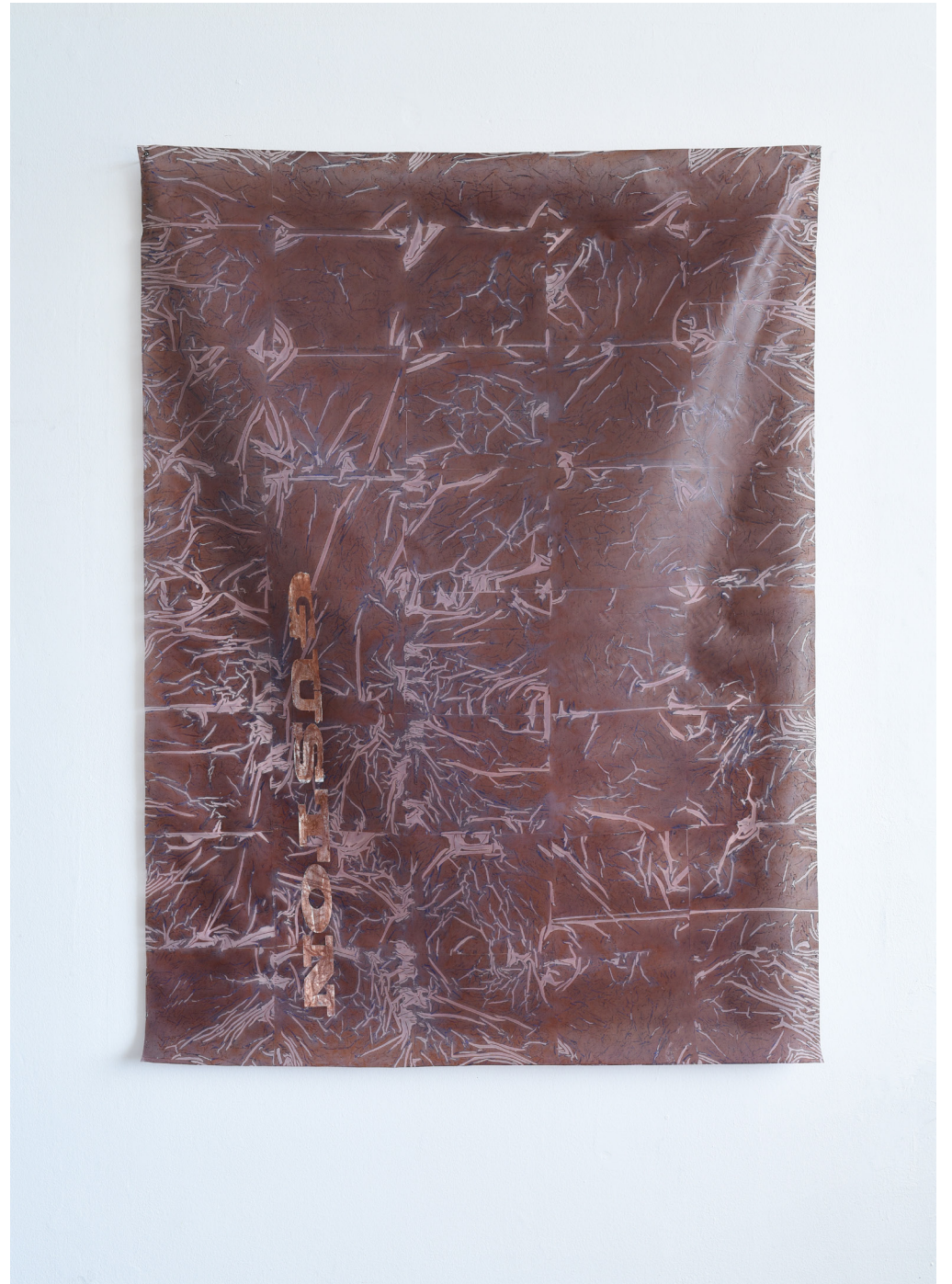
Guston, acrilico e olio su poliestere, 145x100 cm, 2017.