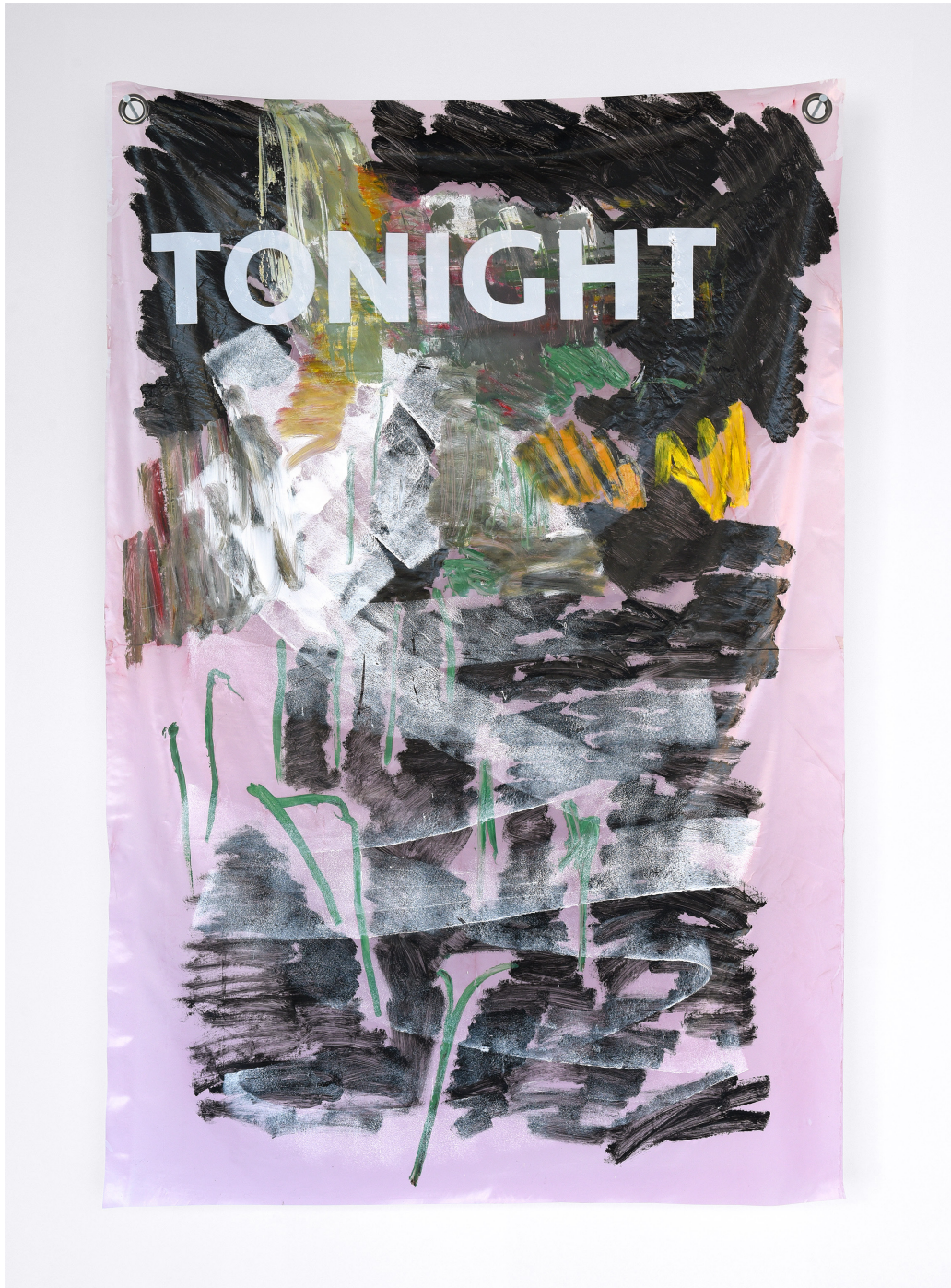
TONIGHT, acrilico su poliestere, 178x119 cm, 2017.