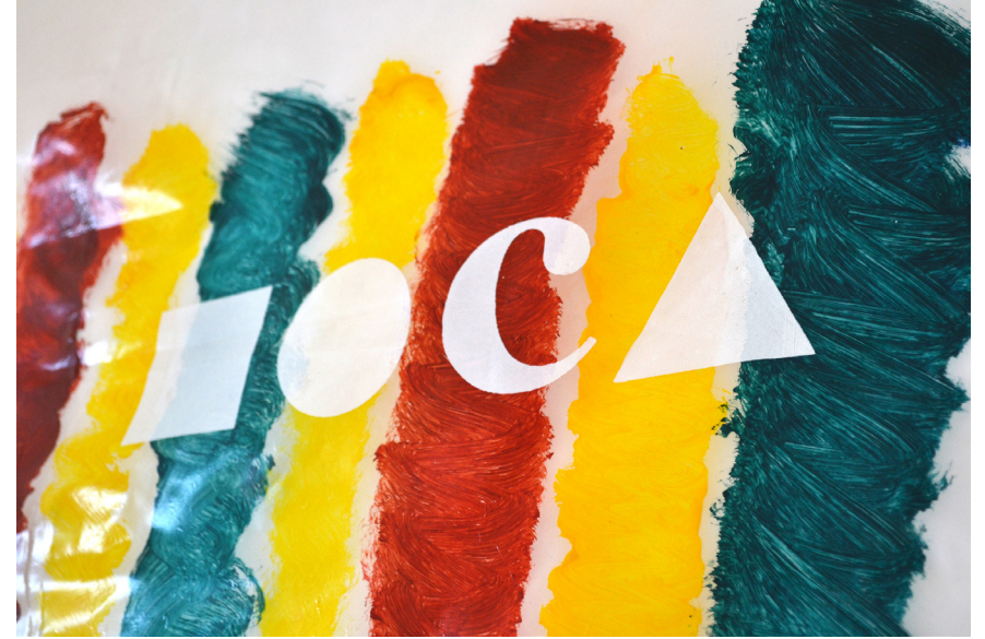
MOCA, acrilico su poliestere, 171,5x111 cm, 2017.