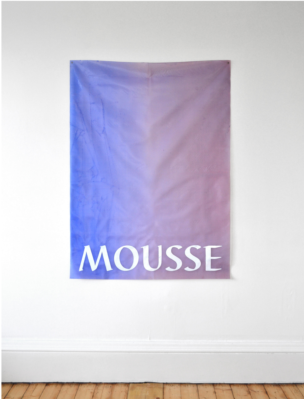
Mousse, acrilico su poliestere, 145x100 cm, 2017.