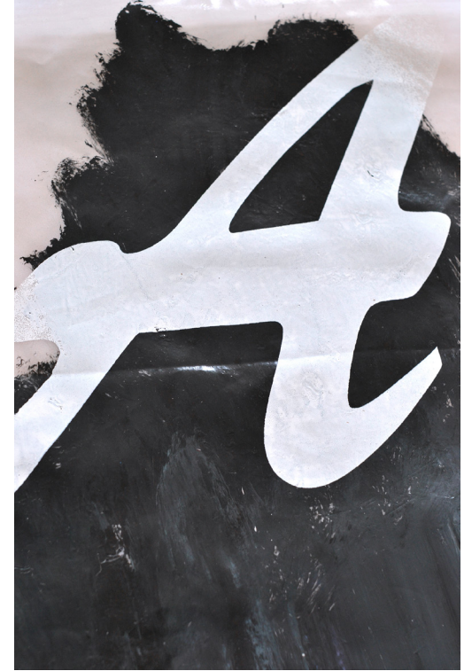
AR, acrilico su poliesteri, 140x89 cm, 2017.