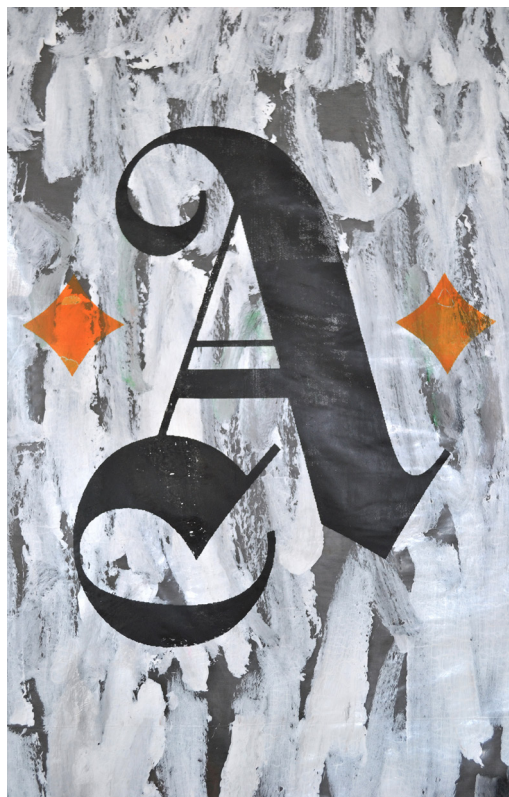
A, acrilico su poliestere, 171x115 cm, 2017.