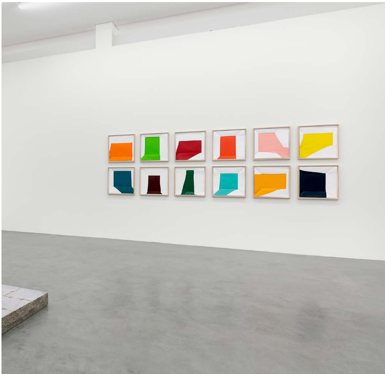
Rainer Splitt Paperpools, 2015 smalto su carta Fabriano 50 x 50 cm (ognuno) Veduta dell'installazione Kunstraum Bürkle, Freiburg courtesy l'artista.