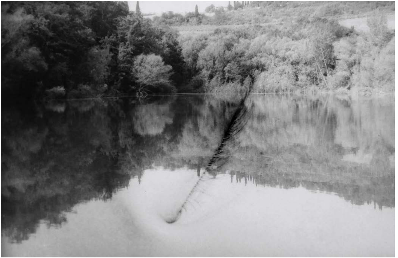
Daniela De Lorenzo Per simpatia , 1998 fotografia in b/n (edizione di 3) 13 x 18 cm (with frame 53 x 38 cm)