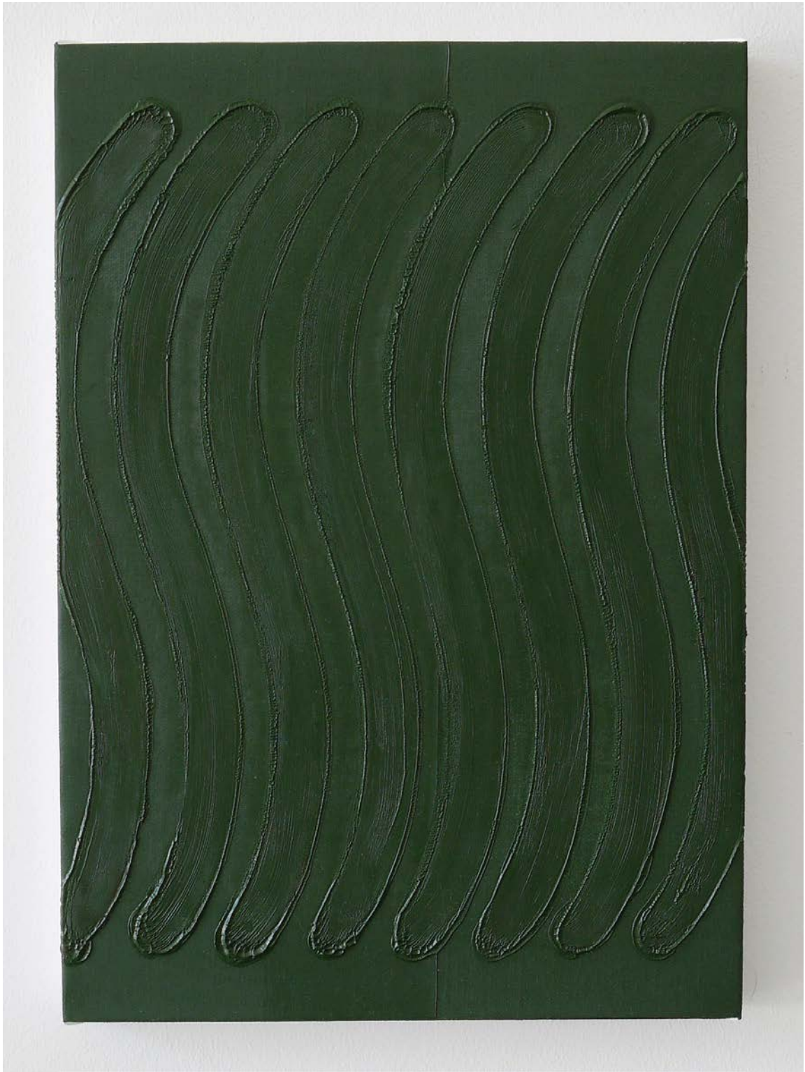
Antonio Catelani Strigliatura , 2016 olio su tela, 33 x 23 cm